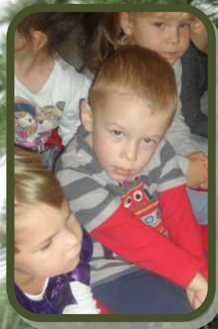
Baross László Utcai Óvoda